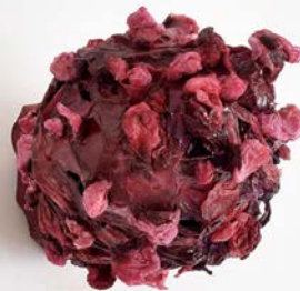
202106 (anmutige, schön gelockte, rosenfingrige Gottheit) 9 x 9 x 12,5 cm / 77 Gramm