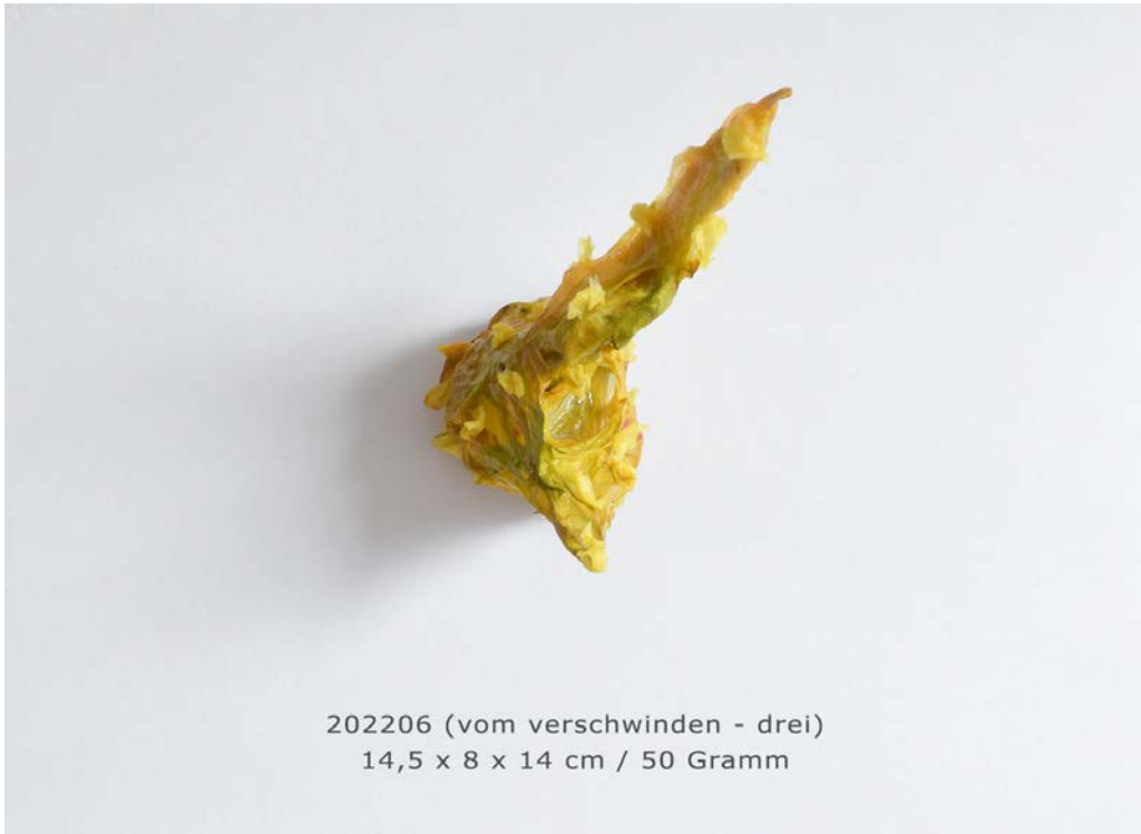
202206 (vom verschwinden - drei) 14,5 x 8 x 14 cm / 50 Gramm