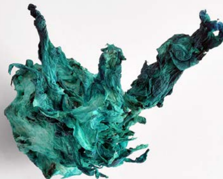
202109 (müder Flug) 11 x 13 x 18,5 cm / 61 Gramm