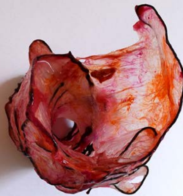
202007 (Scharlach) 15,5 x 12,5 x 17 cm / 125 Gramm